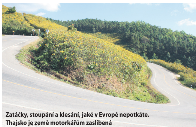
Zatáčky, stoupání a klesání, jaké v Evropě nepotkáte. Thajsko je země motorkářům zaslíbená