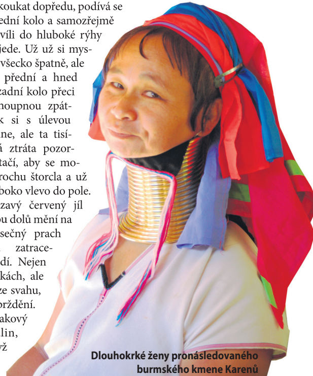
Dlouhokrké ženy pronásledovaného burmského kmene Karenů