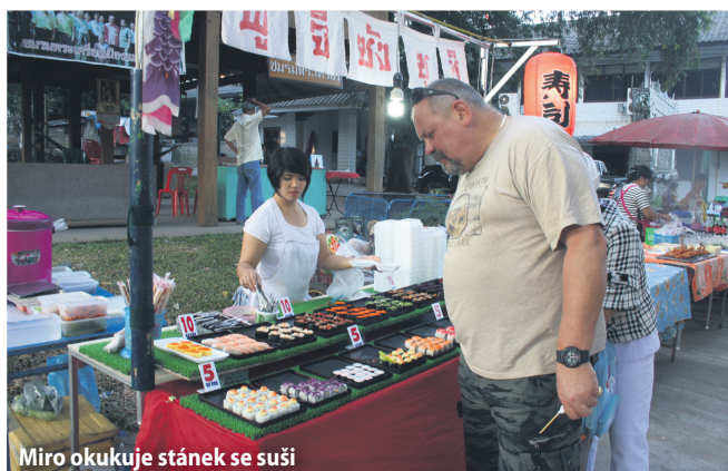
Miro okukuje stánek se suši